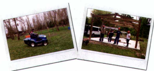
Achat d'un terrain pour l'IMPRO de Corbie

J'adhère et je deviens acteur de l'Association (cotisation : 50€/an)