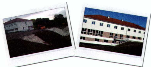
Achat d'une parcelle de 9000 m 2 à Villers Bretonneux pour le Foyer de Vie de l'Aquarelle

au financement d'achats de terrains pour la construction de nouvelles structures d'accueil médico-sociales